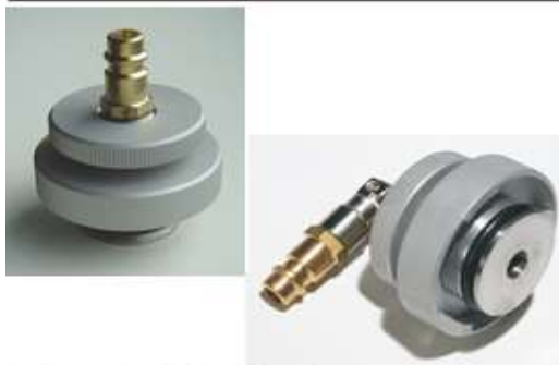
Adapter: BS/BS W-Serie