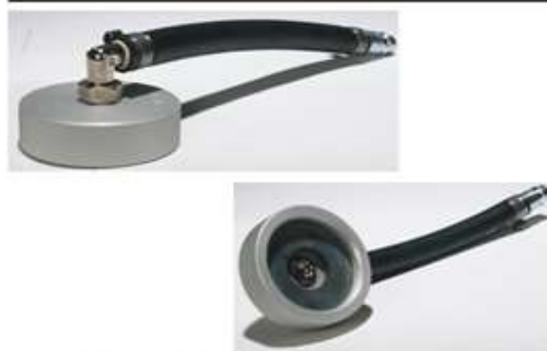
Adapter: E 20 W