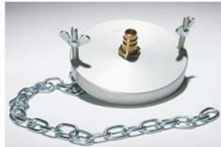
Adapter: U90/U100 K