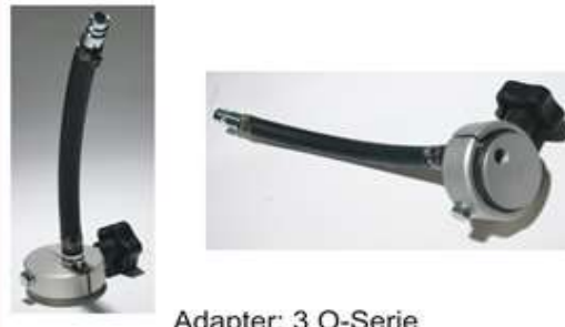
Adapter: 3 O-Serie